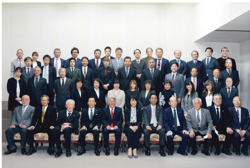
2021年.新居浜ひうちライオンズクラブ25周年記念 令和3年1月