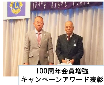
100周年会員増強 キャンペーンアワード表彰