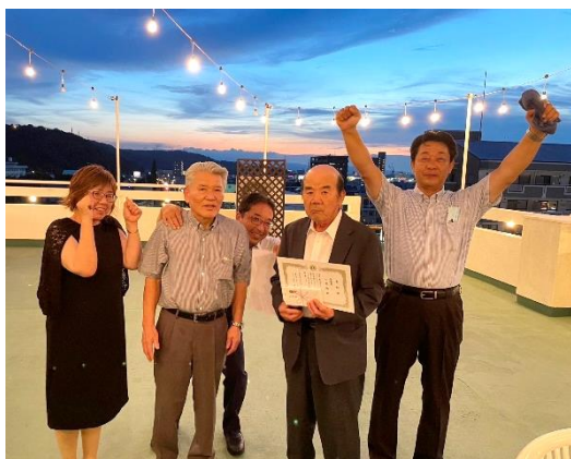
2022 年度皆勤賞 5 名