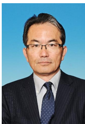
ライオンテーマー

皆様には、この1年ご迷惑をかけることもあるかと思いますが、これからもご指導ご協力を宜しくお願いいたします。