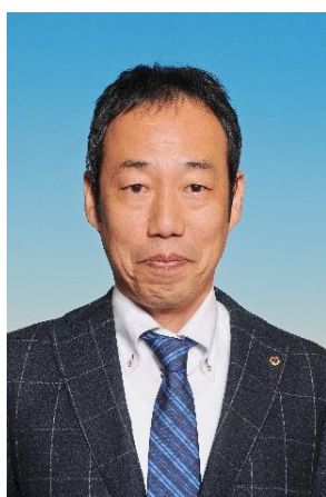
テールツイスター

私の座右の銘は、「心こそ大切なれ」です。一層、ひうちライオンズクラブの発展に寄与できますよう頑張ります。