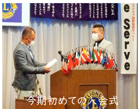
今期初めての入会式

振り返るとイントロクイズは、会員のみんなが我を忘れてクイズを当てたり、歌ったり、楽しんでいたね。面白いのが一番だと思いました。ありがとう。さようなら・・・