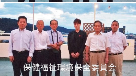
保健福祉環境保全委員会