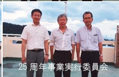
25周年事業実行委員会