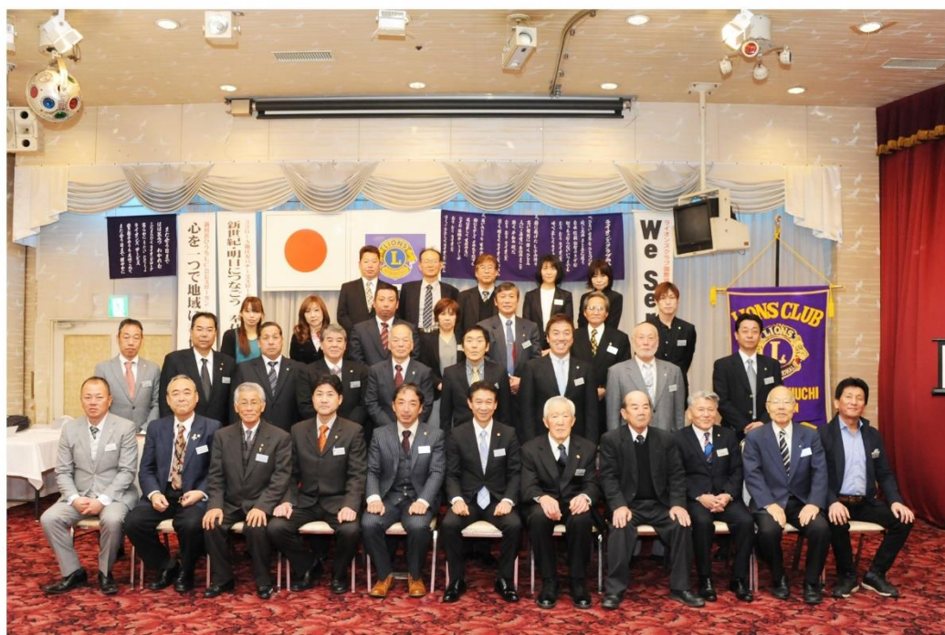
2018.1.9 第1回例会 集合写真（ふじ）