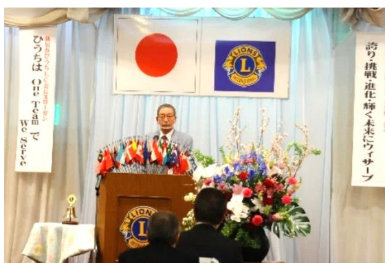
酒井地区ガバナーにご出席いただきました