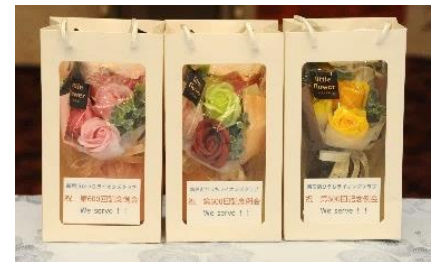
＊ 第 600 回記念例会 ＊ little flower さんのシャボンブーケ

越智慈子 皆様結成 25 周年記念大会、準備から当日、後と大変お疲れ様でした。メンバーの皆様、事務局日野さんのご協力に感謝、このような機会をいただいたことに感謝します。