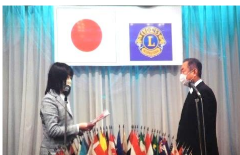
遊具目録贈呈（事前撮影）