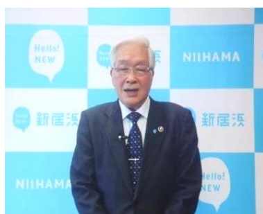
新居浜市長より祝辞動画