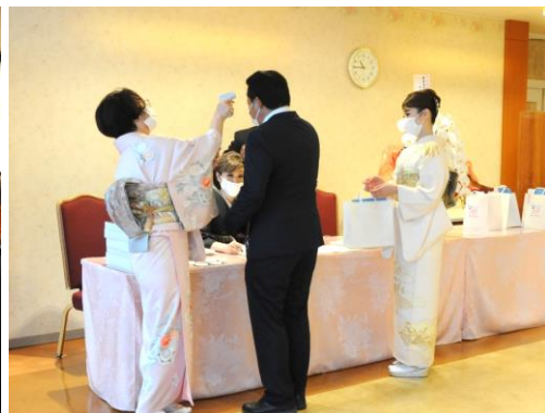
ソーシャルディスタンス・検温・手指消毒・マスク着用など、感染症対策を徹底