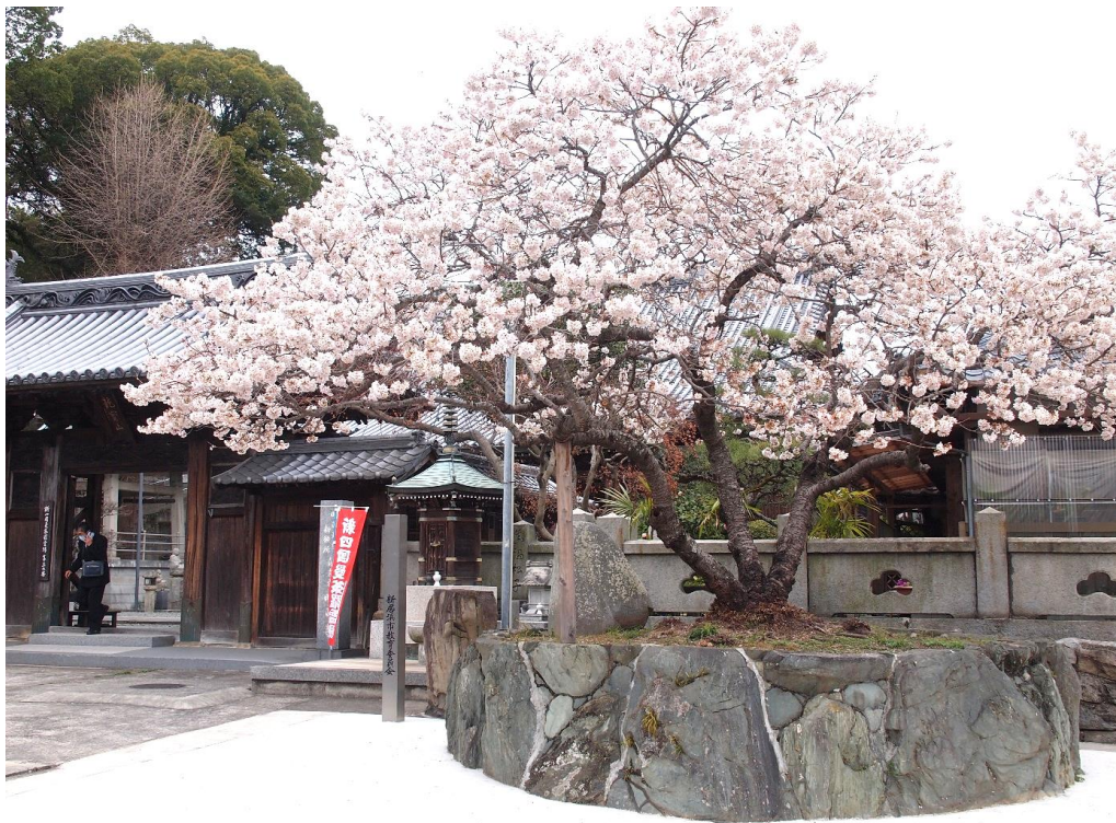
新居浜市黒島 明正寺 ミヨウショウジサクラ