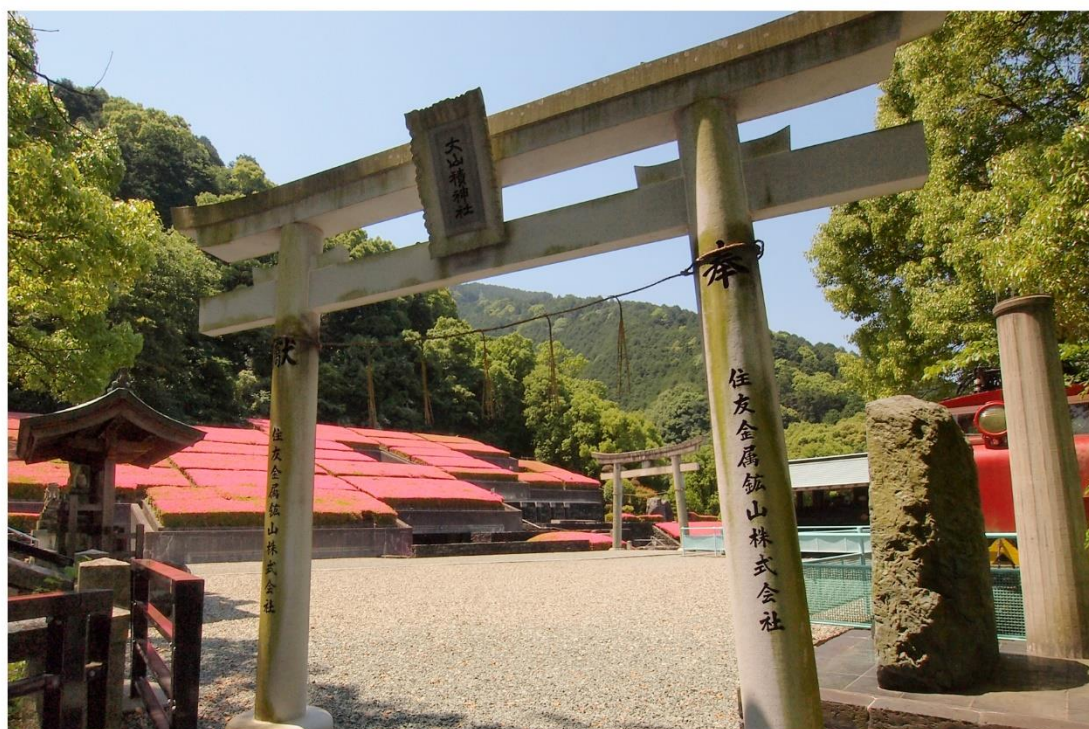
2021.5.23 山根 別子記念館のさつき