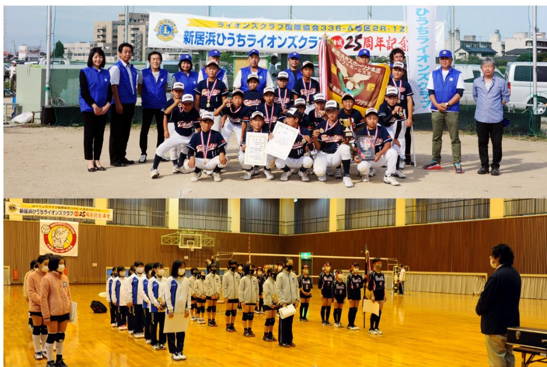
2020.9.19 少年ソフトボール大会 2020.11.15 小学生バレーボール大会