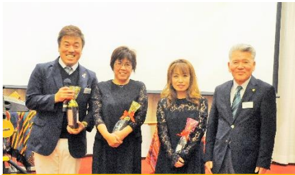
1 2月誕生祝の皆さんと会長