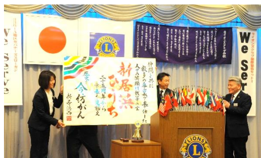
新居浜市立西高書道部の皆さんから書道作品を戴きました。