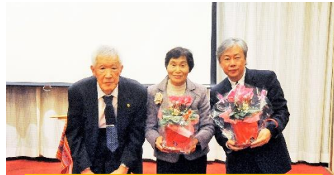
1 2月結婚記念月の皆さん