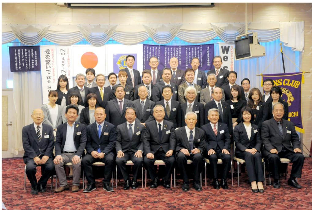
2019.1.8 第1例会 集合写真（ふじ）